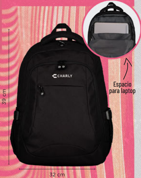
C68114 NEGRO | ÚNICA ·Tres compartimentos ·Cierres brandeados