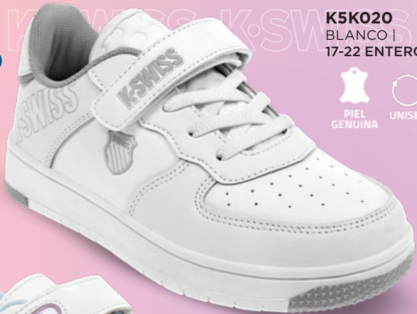
K5K020 BLANCO | 17-22 ENTEROS