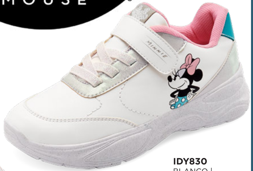
IDY830 BLANCO | 18-21 ENTEROS