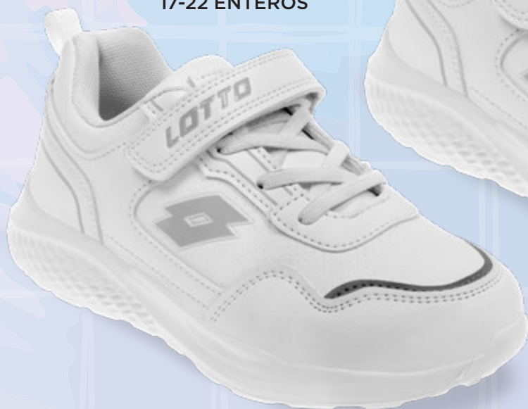
L5H437 BLANCO | 17-22 ENTEROS