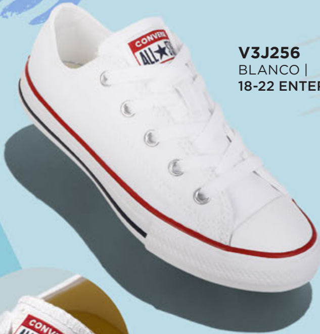
V3J256 BLANCO | 18-22 ENTEROS