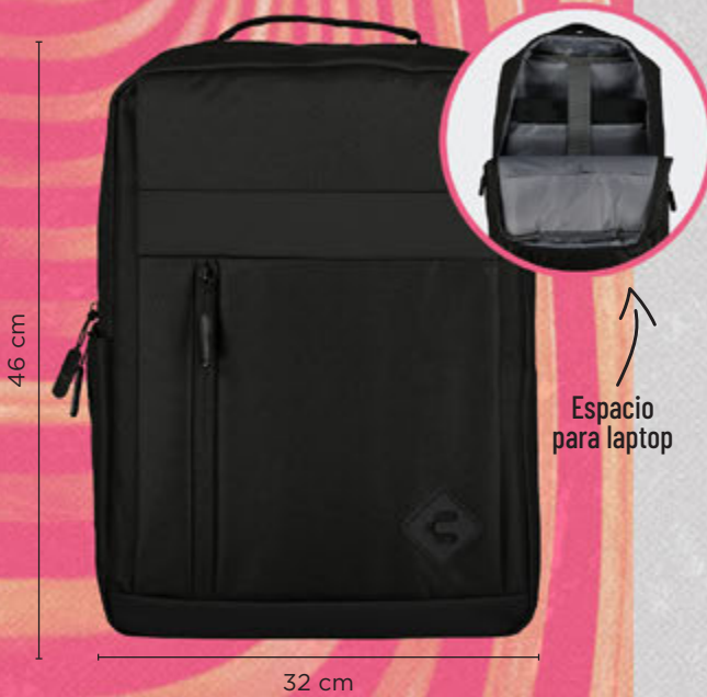
C68152 NEGRO | ÚNICA ·Dos compartimentos ·Asas ajustables ·Bolsillo al frente