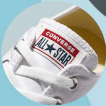
V7J253 BLANCO | 12-17 ENTEROS