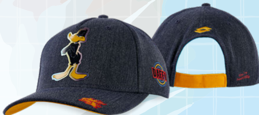
LDAF02 NEGRO | ÚNICA