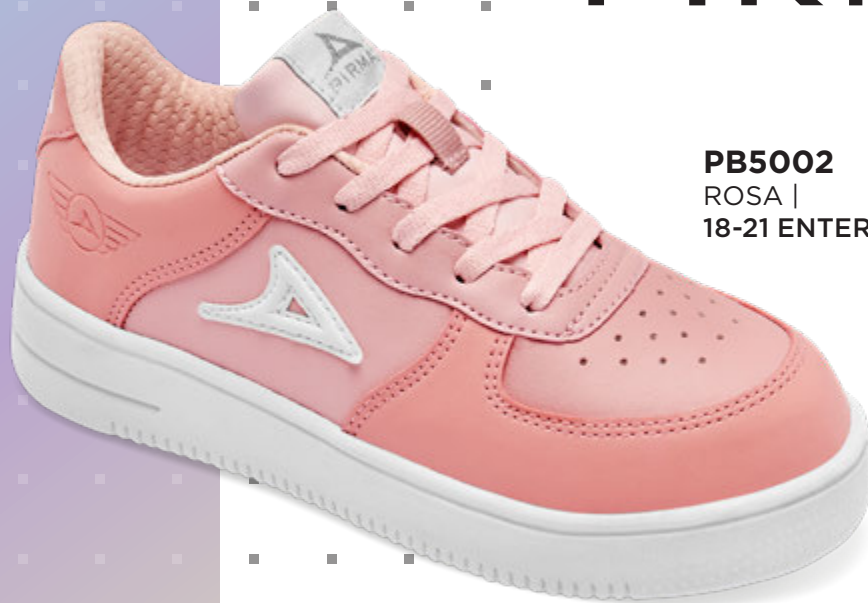
PB5002 ROSA | 18-21 ENTEROS