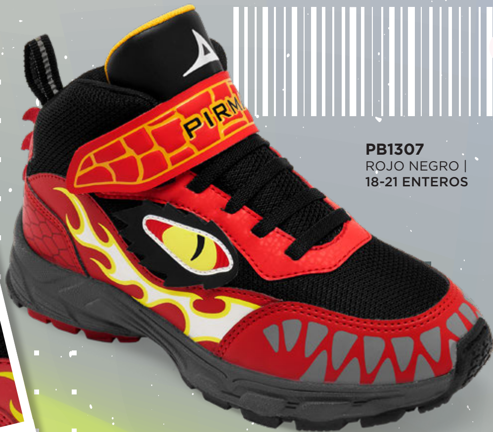
PB1307 ROJO NEGRO | 18-21 ENTEROS