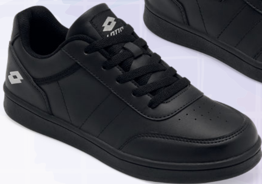
L8H447 NEGRO | 23-25 ENTEROS