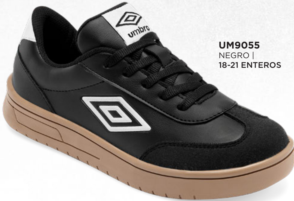
UM9055 NEGRO | 18-21 ENTEROS