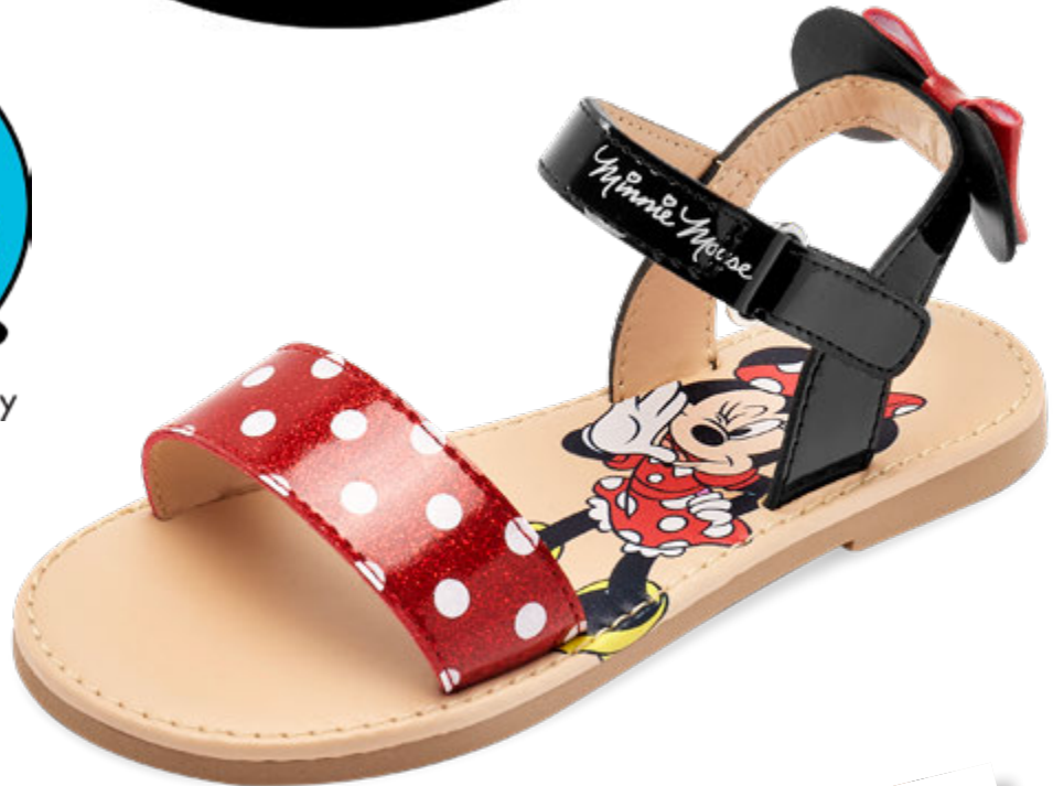
IDY655 ROJO | 15-17 ENTEROS 18-21 ENTEROS