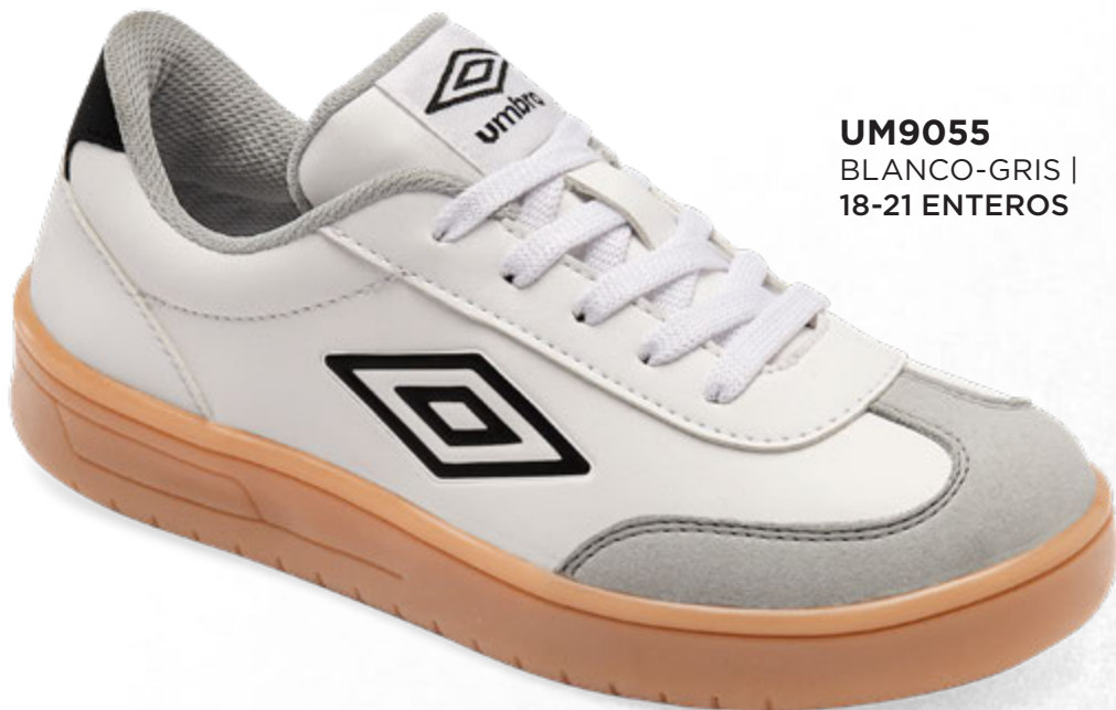
UM9055 BLANCO-GRIS | 18-21 ENTEROS