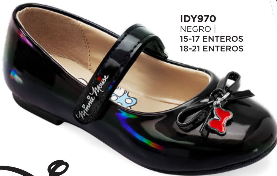
IDY970 NEGRO | 15-17 ENTEROS 18-21 ENTEROS