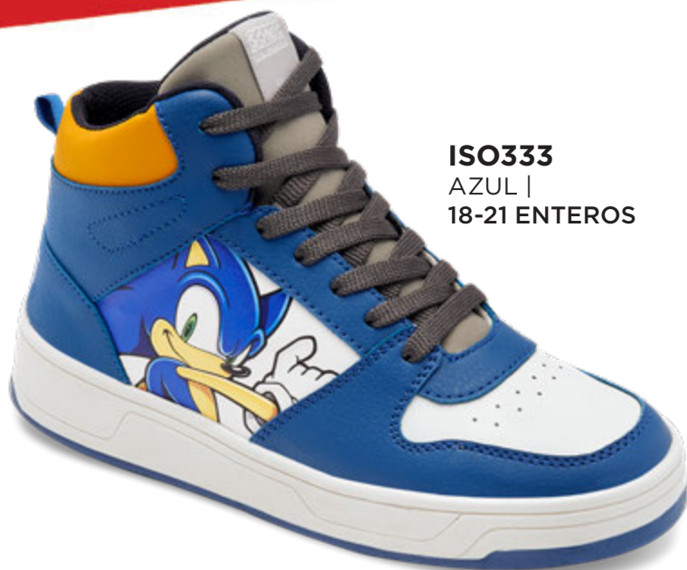
ISO333 AZUL | 18-21 ENTEROS