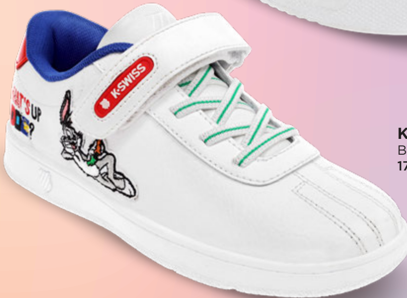
K5F647 BLANCO-MARINO | 17-22 ENTEROS