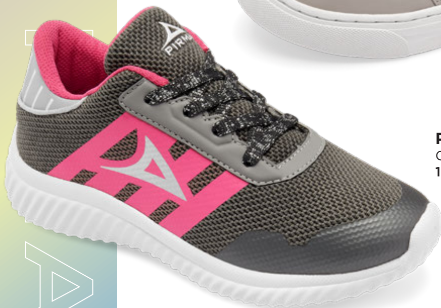
PB8014 OXFORD | 18-21 ENTEROS