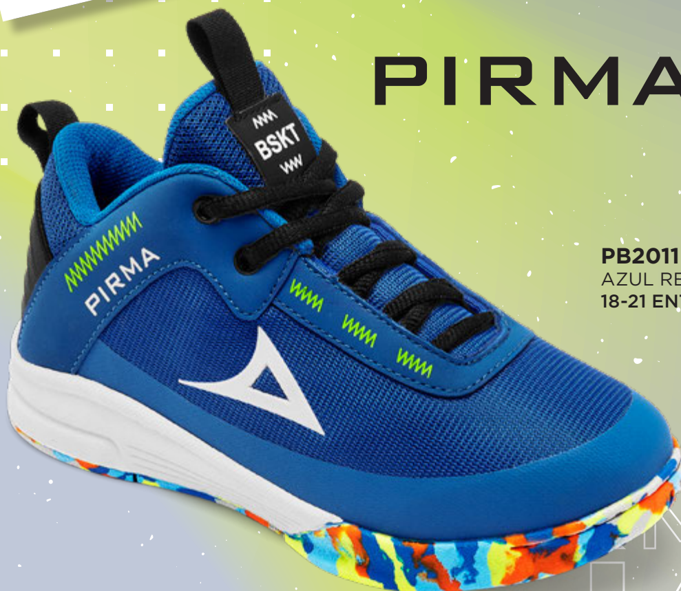
PB2011 AZUL REY | 18-21 ENTEROS