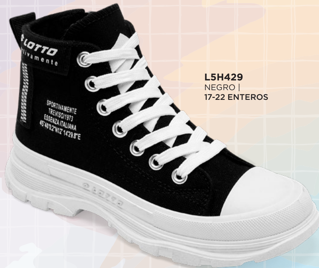
L5H429 NEGRO | 17-22 ENTEROS