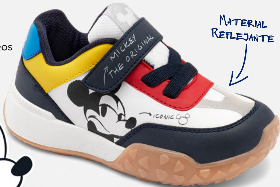
IDY900 BLANCO | 18-21 ENTEROS