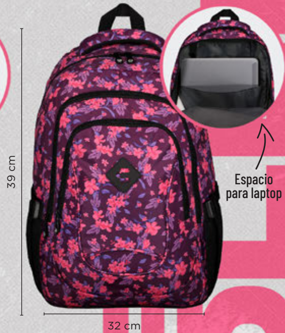
C80681 FIUSHA MULTI | ÚNICA ·Bolsillos de mesh ·Cierres brandeados