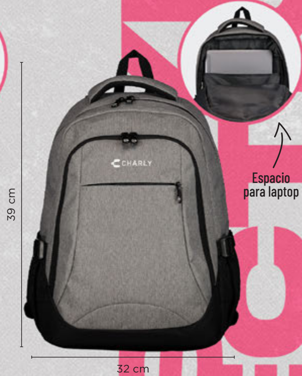
C68114 GRIS | ÚNICA ·Tres compartimentos ·Bolsillos de mesh