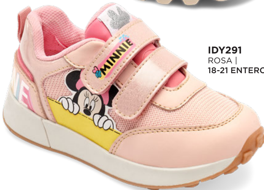
IDY291 ROSA | 18-21 ENTEROS