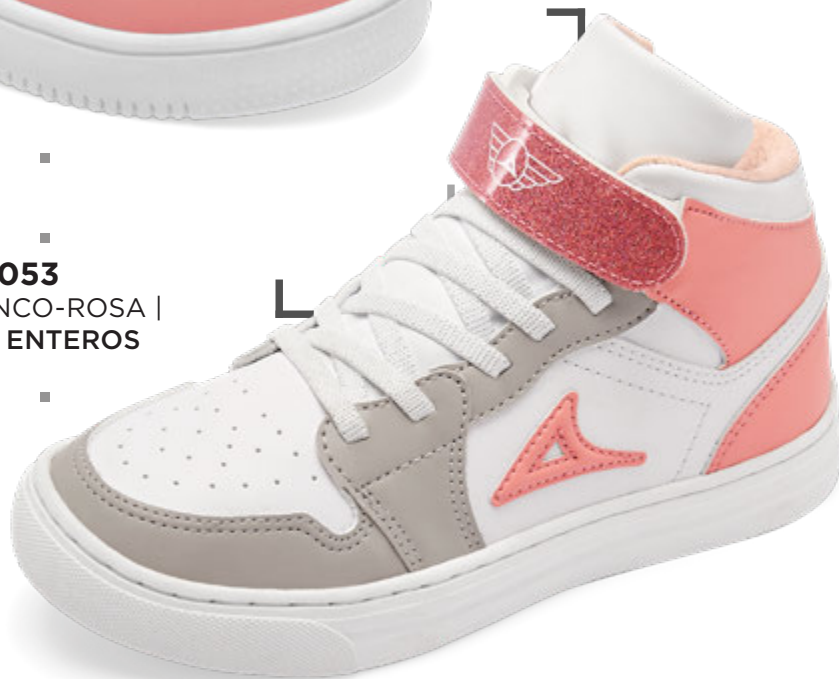
PB5053 BLANCO-ROSA | 18-21 ENTEROS