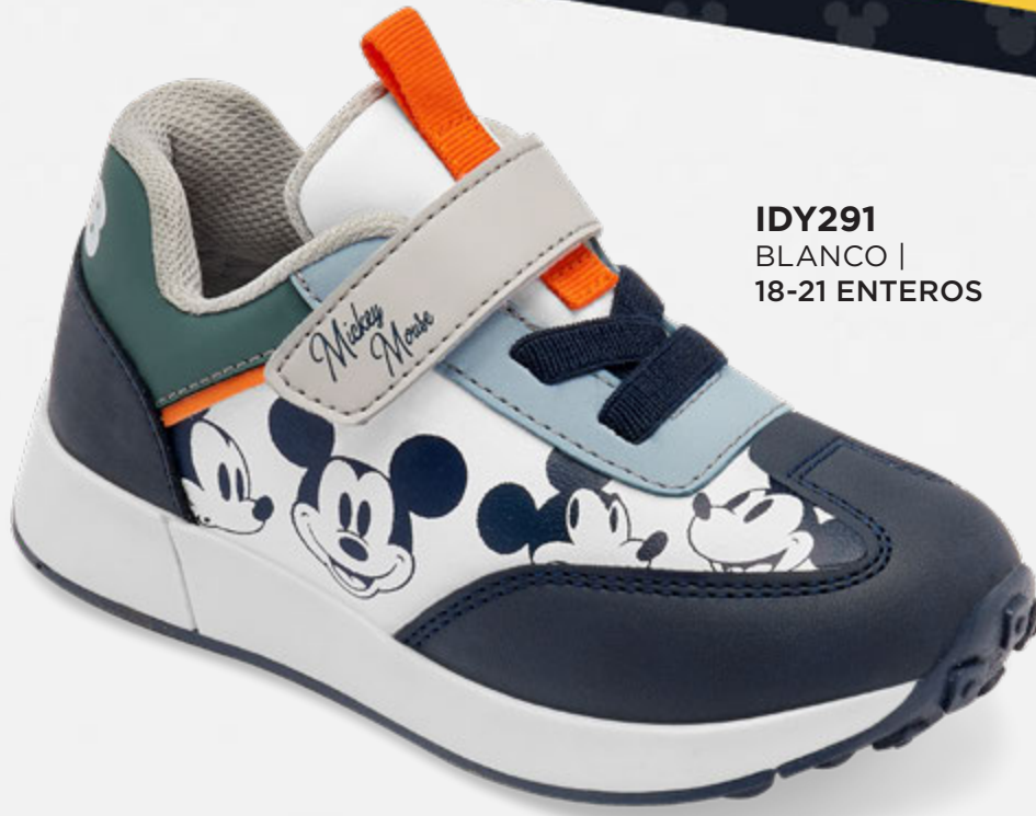
IDY291 BLANCO | 18-21 ENTEROS