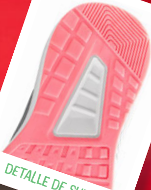
DETALLE DE SUELA