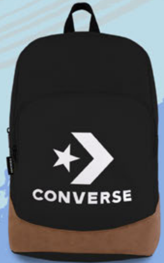
VM1301 NEGRO | ÚNICA