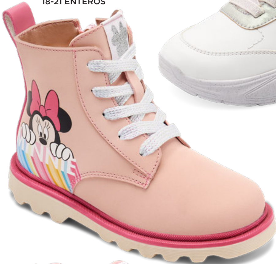
IDY888 ROSA | 18-21 ENTEROS