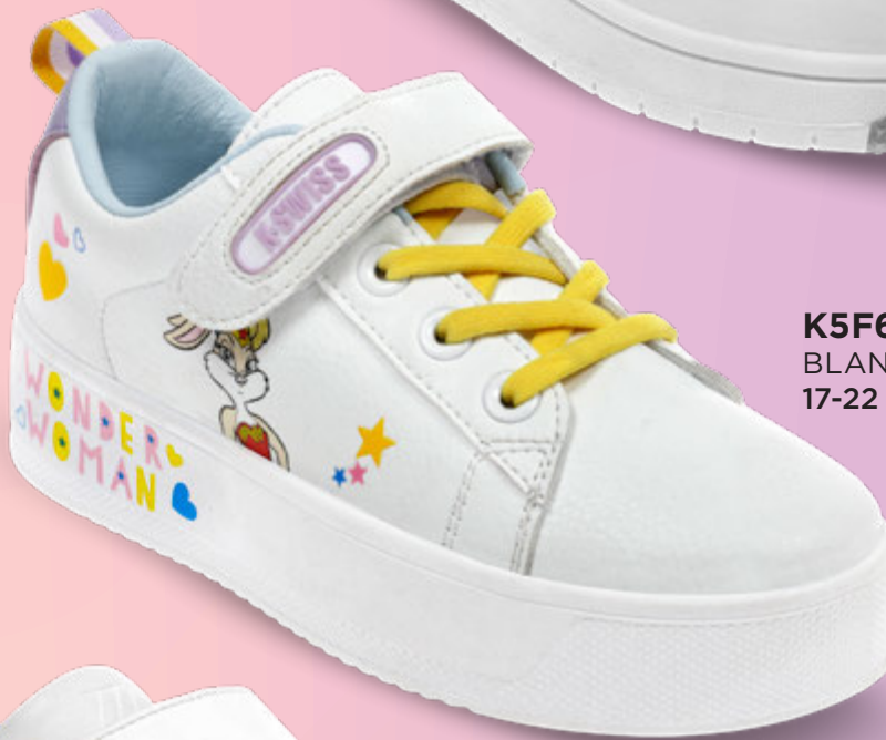
K5F665 BLANCO-LILA | 17-22 ENTEROS