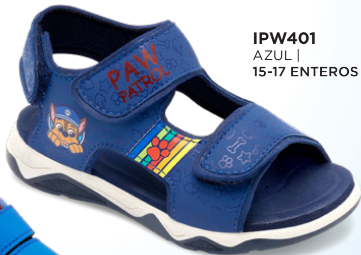
IPW401 AZUL | 15-17 ENTEROS