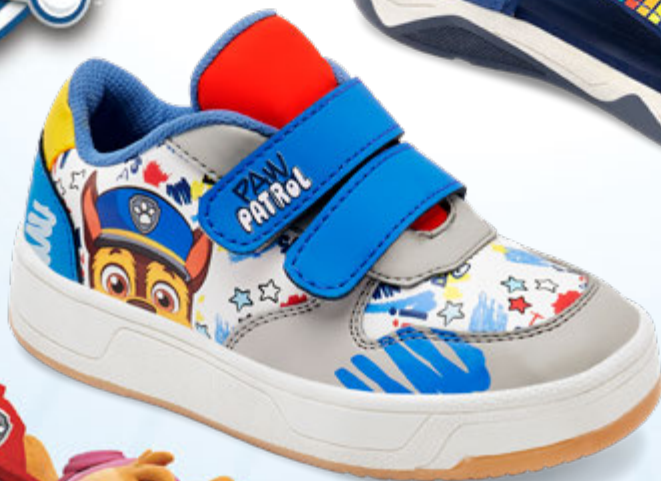
IPW332 BLANCO | 15-17 ENTEROS