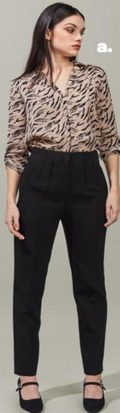
BLUSA HOLLY LAND® MOD G343