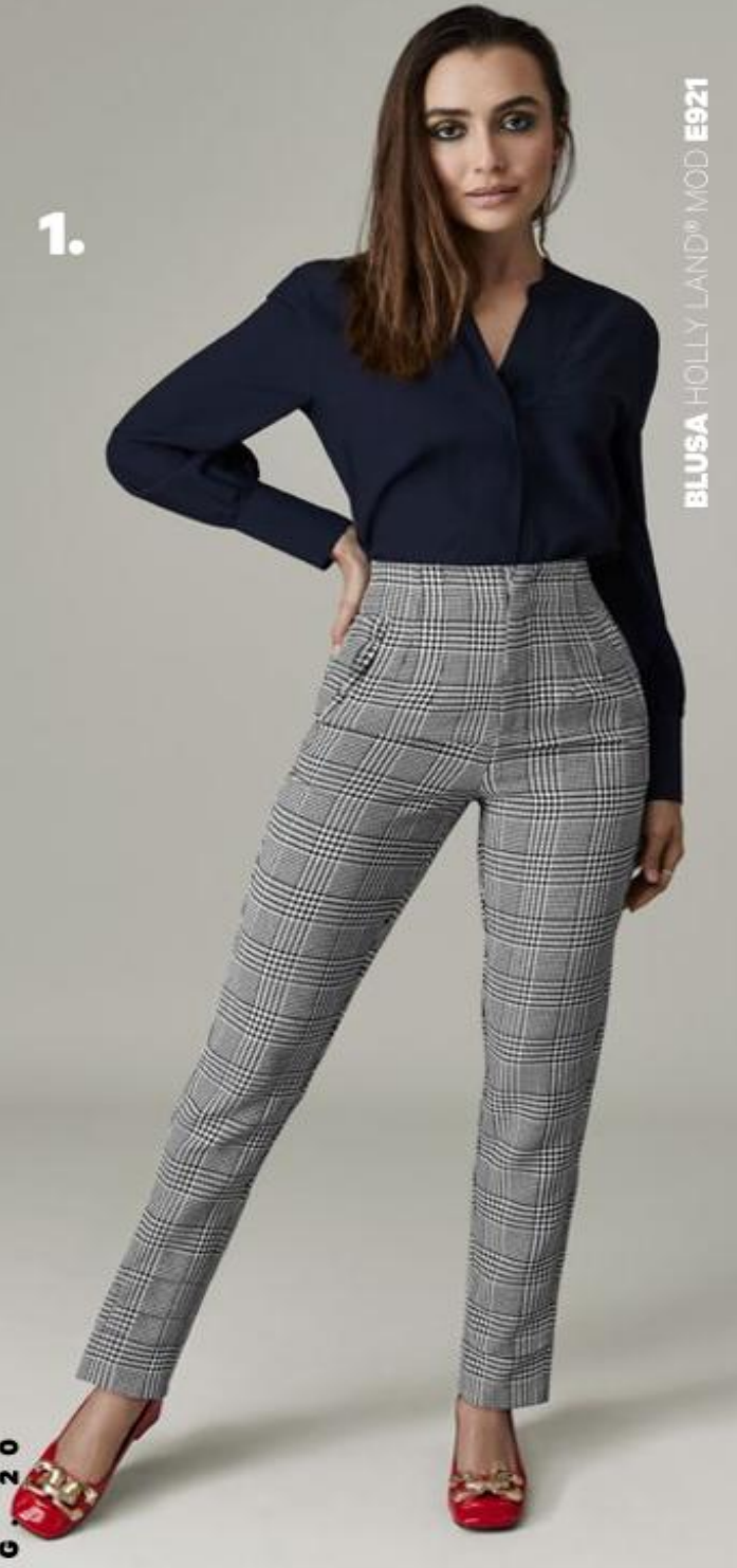
BLUSA HOLLY LAND® MOD E921

1. Pantalón/HOLLY LAND® MOD E999 ID 1091121